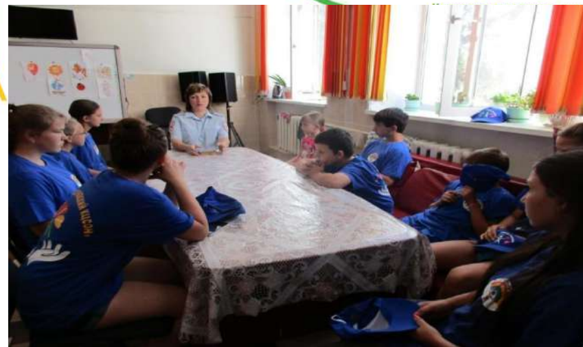
нерства. ддержки детей, и ситуации