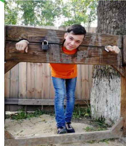
бства, держки детей, ситуации